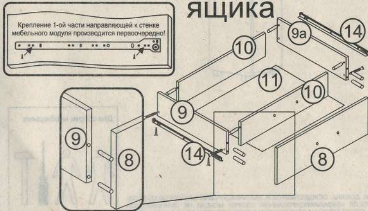
Схема сборки выдвижного ящика

Ниже представлены символы и количество фурнитуры, которая будет необходима при сборке. Фурнитура упакована в коробке "Фурнитура".