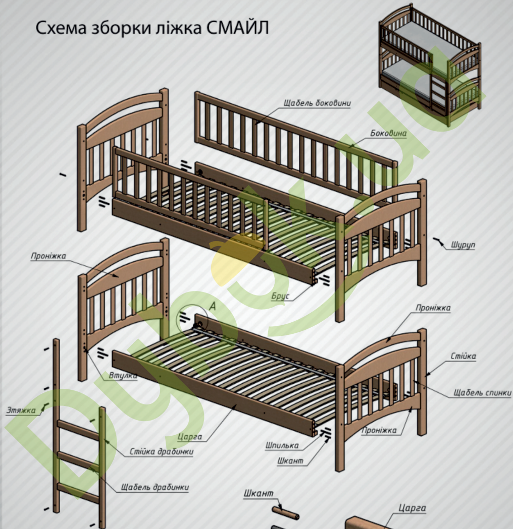
Схема зборки ліжка СМАЙЛ